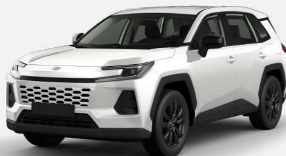
PLATINUM PEARL WHITE