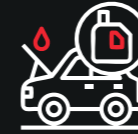
Cambio de aceite y filtros