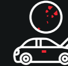
Servicio de mantenimiento