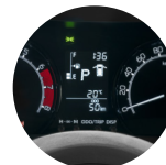
Rendimiento de combustible de hasta 72 KM / galón*