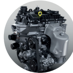
Motor 1.200ccDual VVT 12 válvulas, 87 HP

Raize también está disponible en versión automática CVT de 7 velocidades, siendo compacta y liviana, para una alta eficiencia mecánica con menor consumo de combustible.