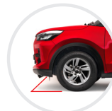
Gran Altura al piso