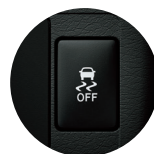
Control de Tracción (TRC) y control de Estabilidad (VSC)