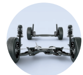
Suspensión frontal tipo MacPherson