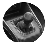
Transmisión manual de 5 velocidades

* El consumo de combustible varía según el tipo de conducción.