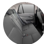
Asientos de tela