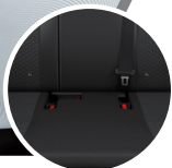
Asientos con anclaje ISOFIX

Si nos adentramos un poco más en seguridad, El nuevo RAIZE cuenta con 2 airbags SRS para conductor y copiloto. Está equipado con un sistema de frenos ABS+EBD, control de tracción (TRC) y de estabilidad (VSC), asistente de arranque en pendiente (HAC), cinturones de seguridad (3 puntos) de última generación, bloqueo de protección infantil, ISOFIX. Características que generan confianza y tranquilidad al conducir un Toyota.