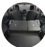
Capacidad del maletero 369L

Cuenta con un espacio de carga de 369 litros. Además, hay múltiples compartimentos para guardar objetos a lo largo de la cabina.