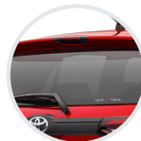
Aleron con 3era luz de stop