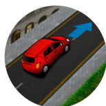
Asistente de arranque en pendientes (HAC)