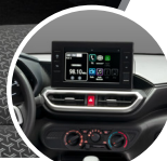
Pantalla touch de 8"

La suspensión trasera del nuevo Raize cuenta con una barra de torsión que brinda un excelente performance en diversas situaciones.