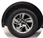
Llantas y aros R16 (Aros de aleación opcionales)