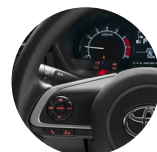
Mandos al volante