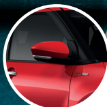
Luz direccional en los retrovisores

A nivel estético, el Toyota Raize destaca por un diseño de líneas rectas que le da robustez.