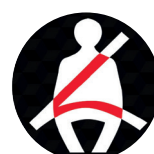
Alerta de cinturón abrochados para 5 pasajeros