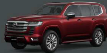
Dark Red Metallic