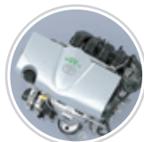
Motor DOHC Dual VVTi 1.500 cc 16 válvulas, 105 HP

Yaris Sedán cuenta con un excelente balance de performance y confort. Su motor de 1.5 litros con Dual VVTi reparte 105 caballos de potencia con 141 Nm de torque. Está equipado con transmisión manual de 5 velocidades, la cual aporta una sensación de manejo deportiva.