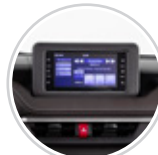
Radio con pantalla táctil de 7" con CarPlay / Android Auto