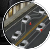
Frenos ABS con EBD, BA, EBS

En Toyota la seguridad siempre es lo primero, Yaris presenta una estructura completamente rediseñada buscando maximizar su eficiencia contra impactos, con refuerzos en su estructura que ayudan a absorber y disipar la energía en caso de colisiones. Cuenta con 6 bolsas de aire ( 2 frontales, 2 laterales, 2 tipo cortina), con sensores que miden la fuerza y ubicación del impacto para activarlas de manera efectiva.