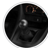
Transmisión manual de 5 velocidades