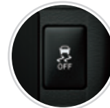
Control de Tracción (TRC) y control de Estabilidad (VSC)