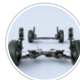
Suspensión frontal tipo MacPherson