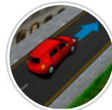
Asistente de arranque en pendientes (HAC)