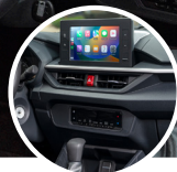
Display multi-información con indicador de conducción ECO

Posee un amplio espacio interior sin perder la esencia de un compacto cómodo, la distancia entre ejes más larga proporciona mayor espacio para sus ocupantes, con materiales de excelente calidad, sin descuidar su apariencia deportiva en cabina, el sonido en tus viajes será envolvente sobre todo tener conectividad total con su pantalla Touch de 8" compatible con Android Auto y Apple Car Play.