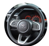
Volante regulable en altura, con mandos incluidos, con dirección eléctrica EPS