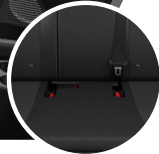
Asientos con anclaje ISOFIX

Si nos adentramos un poco más en seguridad, podemos contar con 2 airbags SRS para conductor y copiloto. Está equipado con un sistema de frenos ABS+EBD, control de tracción (TRC) y de estabilidad (VSC), asistente de arranque en pendiente (HAC), cinturones de seguridad (3 puntos) de última generación, bloqueo de protección infantil, ISOFIX. Características que generan confianza y tranquilidad al conducir un Toyota.