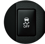
Control de Tracción (TRC) y control de Estabilidad (VSC)