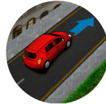
Asistente de arranque en pendientes (HAC)