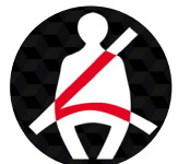
Alerta de cinturón abrochados para 5 pasajeros