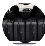
Amplio espacio interior, capacidad del maletero 276L sin Bandeja y 261L con Bandeja