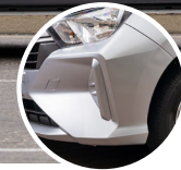
Proporciones ágiles de Go-Kart con voladizos cortos

El nuevo Toyota Agya llega con un estilo poderoso y agresivo con características de un auto deportivo amplio. Destacándose por su diseño ergonómico, su versatilidad y eficiencia el nuevo Agya viene con un look totalmente distinto, con una mirada renovada y aguerrida que cautivará donde lo vean y te dará la seguridad de manejar tu primer Toyota.