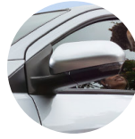
Retrovisores eléctricos abatibles.