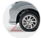
Gran Altura al piso