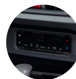
Aire acondicionado digital, bloqueo central y vidrios eléctricos.