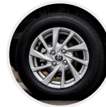
Aros de aluminio rin 14"